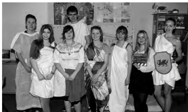
Unter großem Beifall führten Gymnasiasten ein lateinisches Theaterstück auf.