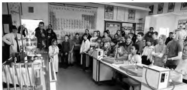
Knackig voll war der Chemieraum, als die Experimentiershow begann.

Was für ein Tag der offenen Tür! Über 600 Besucher zählten die Schüler am Infopoint des Dörfel-Gymnasiums am 26.02.2016. Das Weidaer Gymnasium hatte zum Tag der offenen Tür geladen und demonstrierte in einem Feuerwerk von Angeboten die Leistungsfähigkeit der gymnasialen Ausbildung in der Osterburgstadt. „Mitmachen, fragen, staunen“ – das war wohl die Kurzzusammenfassung der Angebote, die auf die Besucher warteten. Neben Einblicken in die Unterrichtstätigkeit demonstrierten die zahlreichen Arbeitsgemeinschaften das, was man am Dörfel-Gymnasium unter „Sozialer Leistungsschule“ versteht.