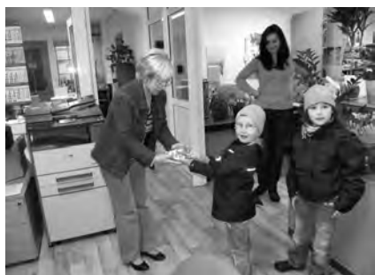
In der Druckerei Wüst