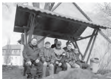
Aufbau der Waldschänke

Die offizielle Übergabe an den Ortsbürgermeister erfolgte am 13.04. durch Vertreter des Männerchors.