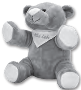
Abb. Trösterbärchen

Kinder und Eltern stehen bei Unfällen häufig unter Stress und Schock. Ein Plüschtier kann den Kleinen dann als Seelentröster helfen. So entstand die Idee zu dem Trösterbärchen. Tommy ist CE geprüft, entspricht der EN-Norm für kindgerechtes Spielzeug und ist natürlich einzeln im Polybeutel verpackt. Der Plüschbär tröstet und hilft den Kindern, Vertrauen zu den Rettungsdienstmitarbeitern und Ärzten aufzubauen. Tommy begleitet sie durch die Behandlungen, und an ihm können sie zeigen, wo sie Schmerzen haben.