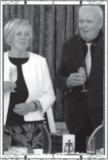
Forstwolfersdorf, im Mai 2024